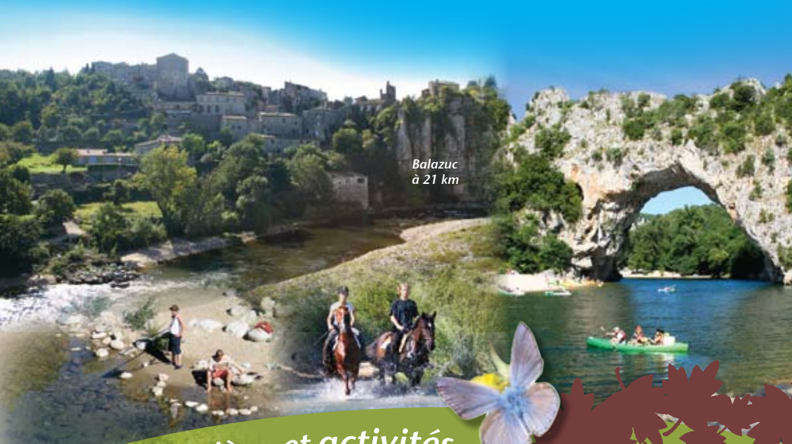
Balazuc à 21 km

sites, rivières et activités... aux alentours